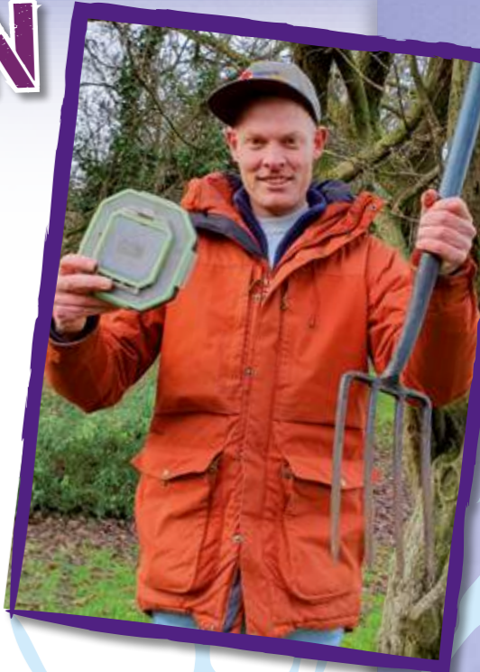
Soms zie je na een regenbui de wormen al op het gras liggen en kun je ze gewoon oprapen.

Ken je het spreekwoord "een vroege vogel vangt veel wormen"? Dat klopt helemaal. Ga dus vroeg in de ochtend of na een regenbui op pad om zoveel mogelijk wormen te vangen. Dan is het gras nog vochtig en zitten de wormen niet te diep in de grond.