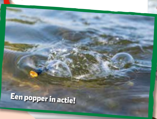
Een popper in actie!