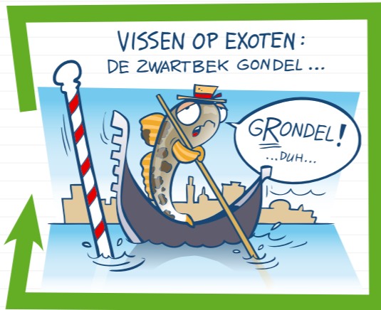
VISSEN OP EXOTEN: DE ZWARTBEK GONDEL ...

dat je over de juiste visdocumenten beschikt. Veel hengelsportverenigingen geven een (gratis) jeugdvergunning uit, waarmee je met één hengel en gewone aassoorten kunt vissen. Vis je met twee hengels of met kunstaas? Dan heb je de JeugdVISpas of – vanaf je 14 de – VISpas nodig. Kijk maar op de website van je plaatselijke hengelsportvereniging of op vispas.nl wat de mogelijkheden zijn. Veel visplezier deze zomer!